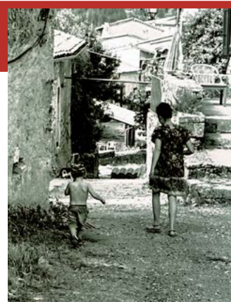
2 EME PRIX : GAËLLE FAYE « BILLIE ET LAURA », AUCELON