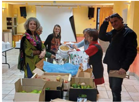
1 ère distribution VRAC à la salle des fêtes en novembre

Nous avons le plaisir de vous annoncer que l'association VRAC Drôme viendra avec sa camionnette une fois par mois livrer ses produits en vrac aux personnes qui auront passé commande au préalable via leur site internet ou durant le jour de permanence mensuel de VRAC sur Saint-Nazaire-le-Désert.